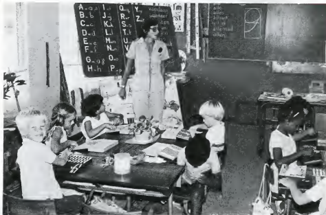
DE VROUW IN HET ONDERWIJS